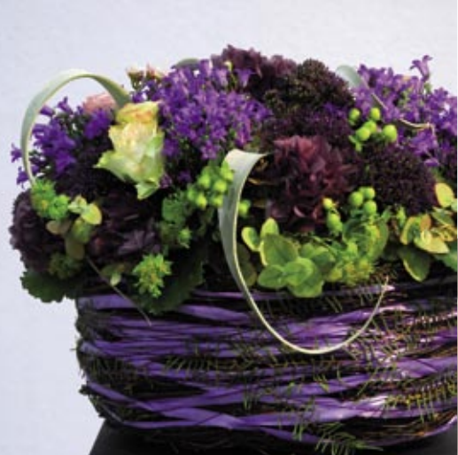
Minisexemplar av Campanula i en dekoration med oasis tillsammans med snittblommor.

Miniväxter säljer bra. De har många användningsområden – de kan stå för sig själva, fungera som kuvertdekorationer på det dukade bordet, flera likadana exemplar kan planteras i en grupp och de kan användas i dekorationer.