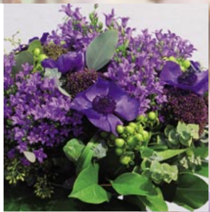
Minisexemplar av Campanula i en bukett av snittblommor.